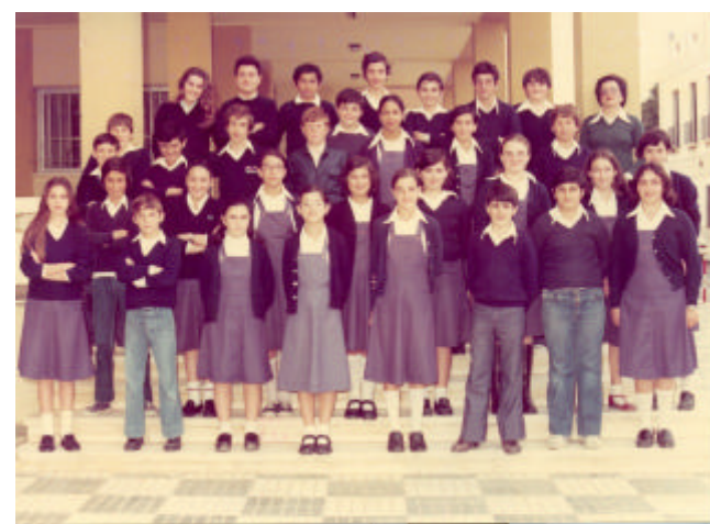
← Colegio Público "Real", desde 1975 hasta 1978