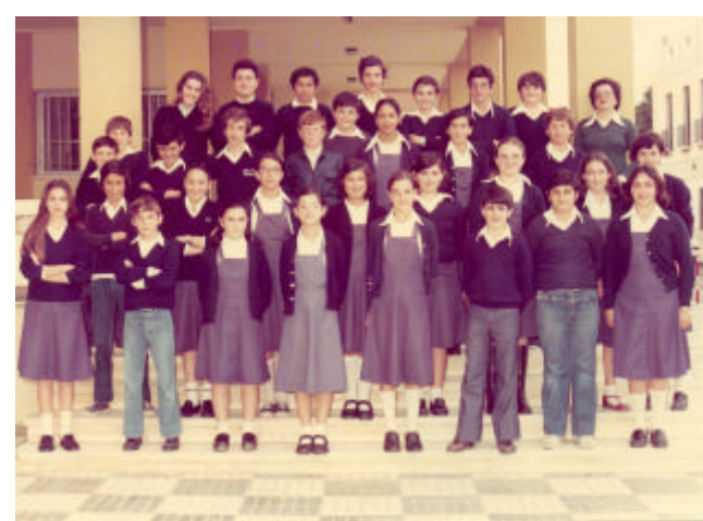
← Colegio Público "Real", desde 1975 hasta 1978