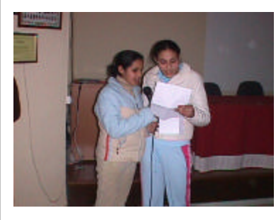
Alumnas de su tutoría leen una dedicatoria a su profesora.

Algunas lágrimas corrían por las mejillas de los presentes. Son muchos años de profesión.