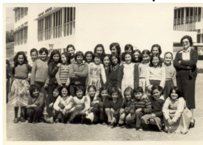
Instituto de Educación Secundaria "Juan Antonio Fernández Pérez", desde 1995 hasta 2005.